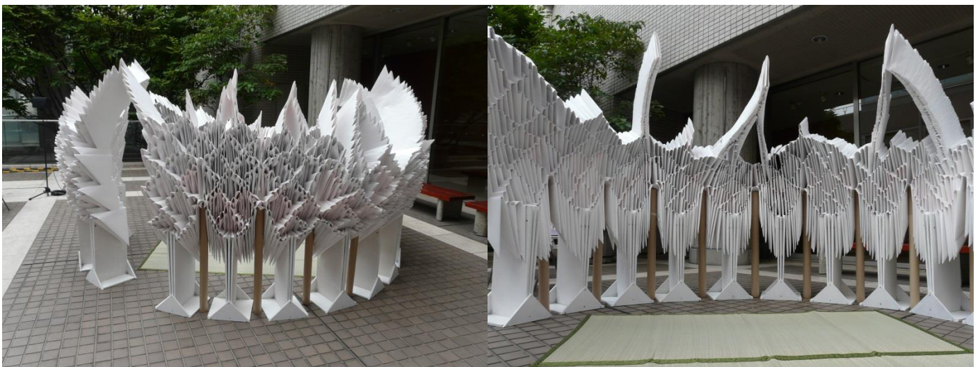
優秀賞：紡ぎ出す空間