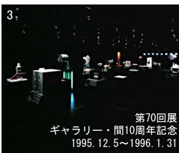
3 第70回展 ギャラリー・間10周年記念 1995. 12. 5~1996. 1. 31