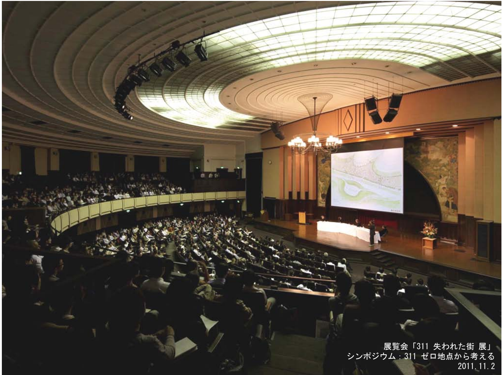
展覧会「311 失われた街 展」 シンポジウム：311 ゼロ地点から考える 2011. 11. 2