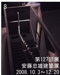
8 第127回展 安藤忠雄建築展 2008. 10. 3~12. 20