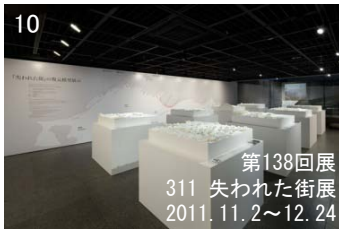
10 第138回展 311 失われた街展 2011. 11. 2~12. 24