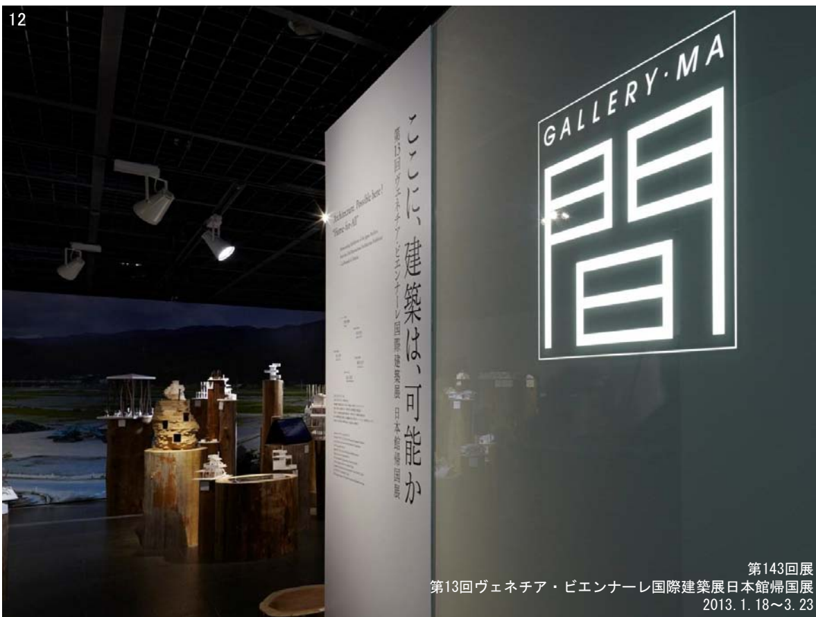
12 第143回展 第13回ヴェネチア・ビエンナーレ国際建築展日本館帰国展 2013. 1. 18~3. 23