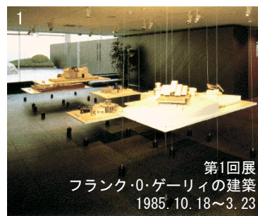
1 第1回展 フランク・O・ゲーリーの建築 1985. 10. 18~3. 23

No.1: © 鈴木喜一 / No.2~3: © 藤塚光政 / No.4~12 : © Nacása & Partners Inc.