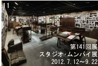
11 第141回展 スタジオ・ムンバイ展 2012. 7. 12~9. 22