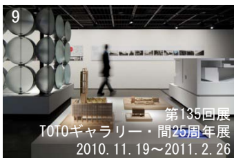
9 第135回展 TOTOギャラリー・間25周年展 2010. 11. 19~2011. 2. 26