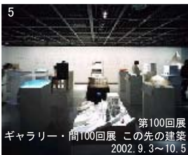
5 第100回展 ギャラリー・間100回展 この先の建築 2002. 9. 3~10. 5