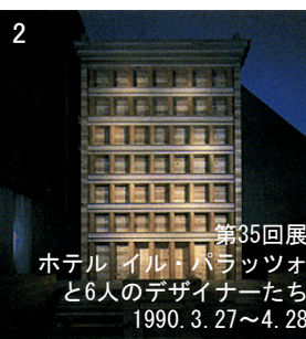
2 第35回展 ホテル イル・バラツォ と6人のデザイナーたち 1990. 3. 27~4. 28